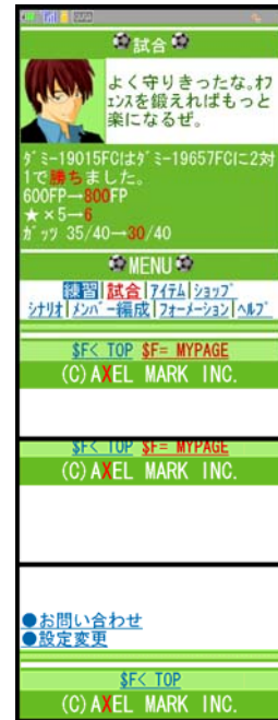
明神コーチからのコメント画像